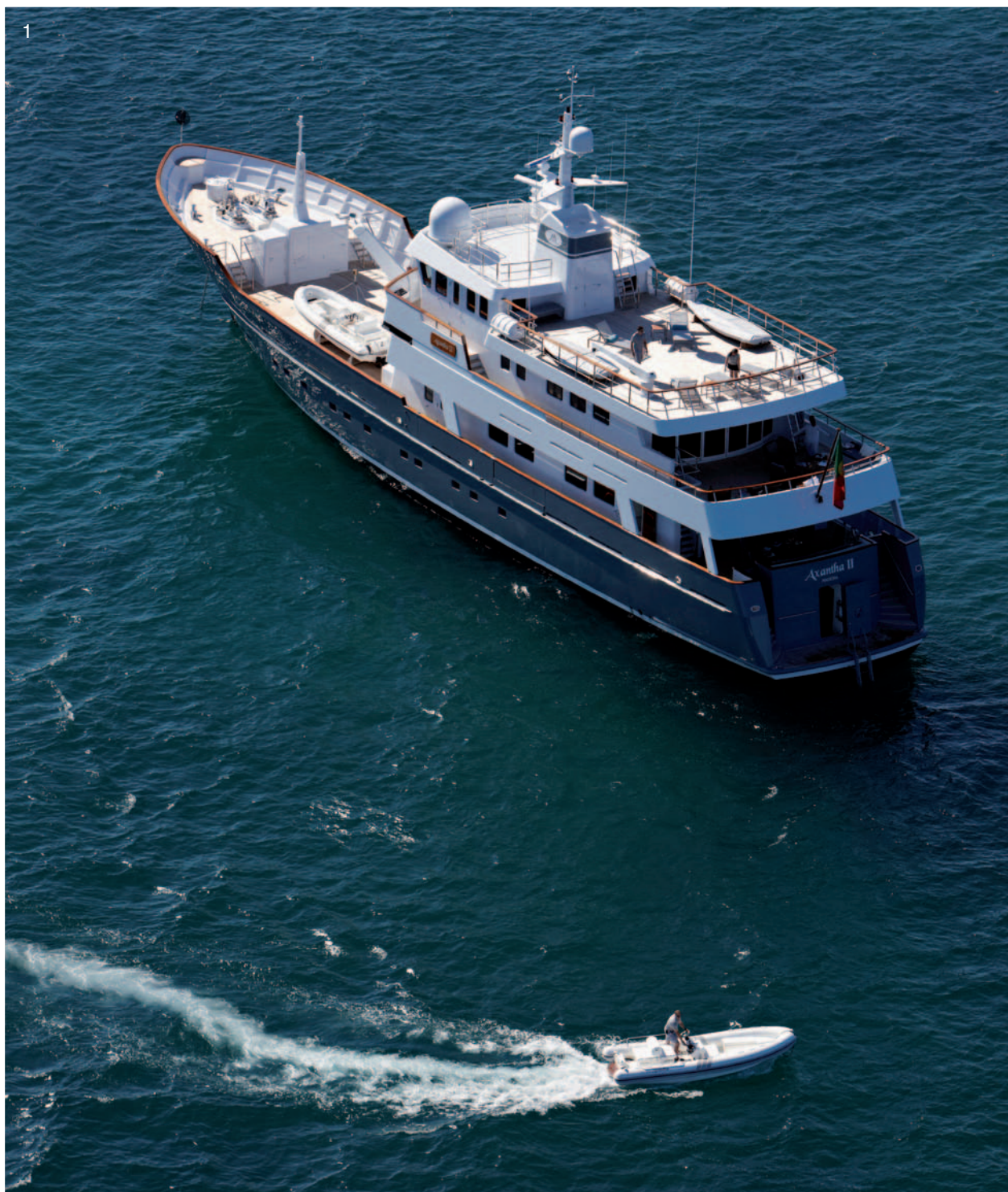
1. Se cuentan hasta siete plataformas exteriores distintas en Axantha II.

Si el primer Axantha, que nuestros lectores descubrieron hace siete años, era ya una muestra de la excelente simbiosis entre el estudio Vripack y el astillero francés JFA, el ejemplar botado en primavera pasada, algo más largo pero sobre todo mejorado en cientos de detalles alcanza casi la perfección.