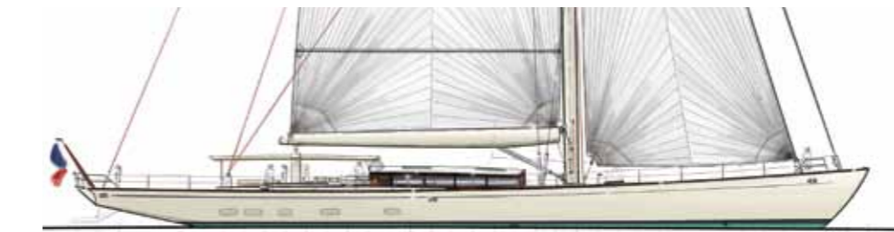
Classic Sloop 125' BARRACUDA YACHT DESIGN