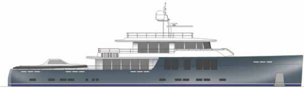
New Explorer 144' DIXON YACHT DESIGN