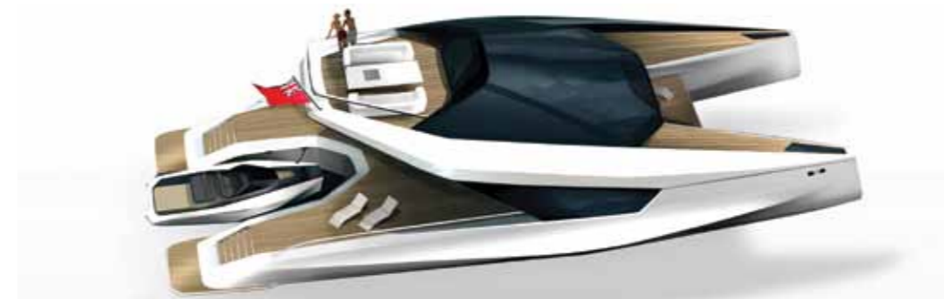
115' POWER CATAMARAN CONCEPT PEUGEOT DESIGN LAB