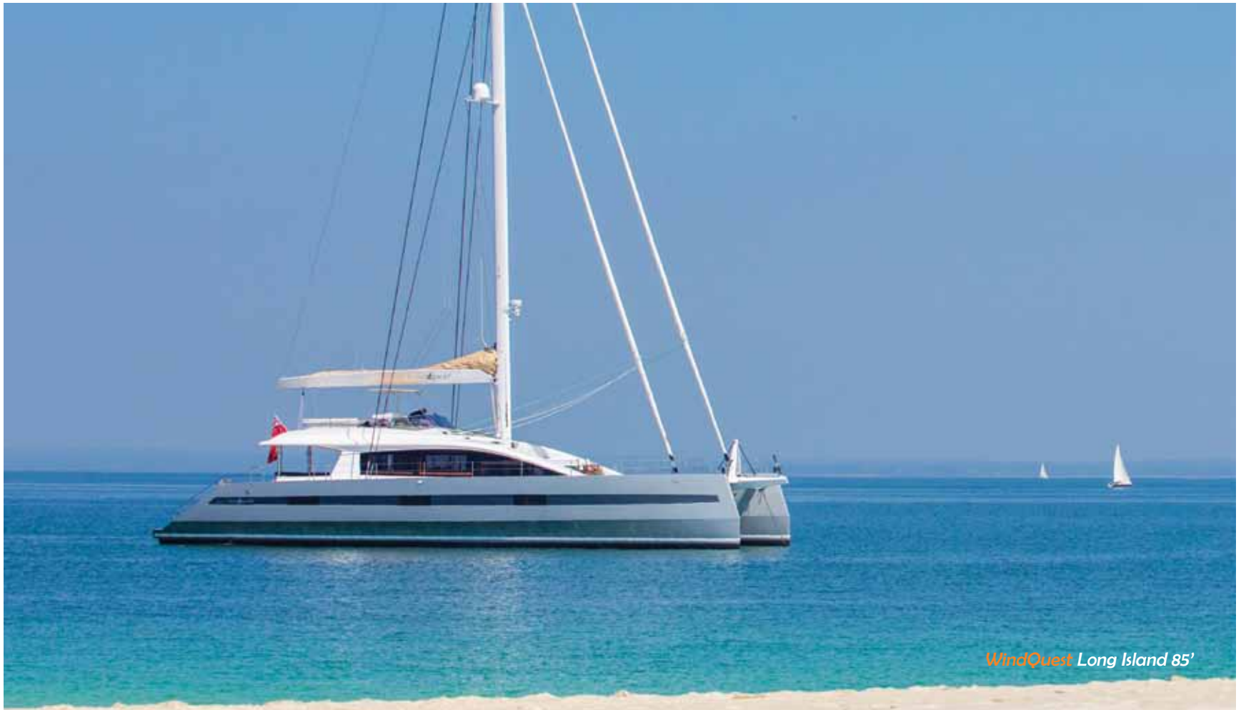
WindQuest Long Island 85'