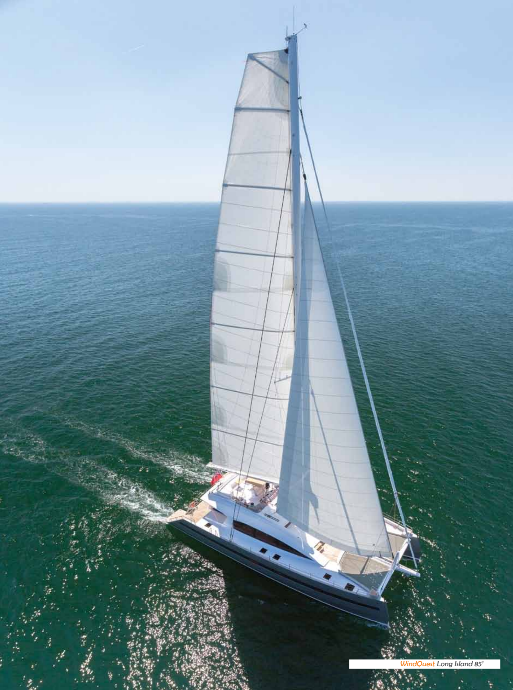
WindQuest Long Island 85'