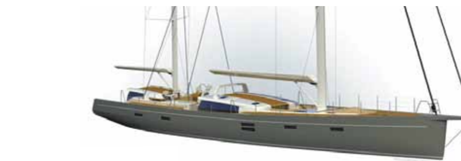
Modern Ketch 100' HUMPHREY AND RHOADES YOUNG DESIGN