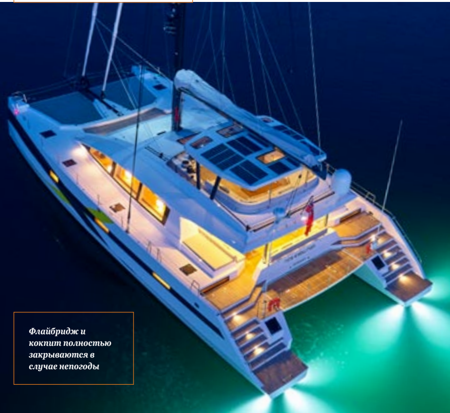
Флайбридж и кокпит полностью закрываются в случае непогоды

NDS Evolution – второй корпус новой серии Long Island 85. Первый корпус был спущен на воду пару лет назад, и его назвали WindQuest. Новинка сохранила лучшие качества предшественника. Как и в случае с первенцем, морскую архитектуру NDS Evolution сделала студия Marc Lombard Yacht Design.