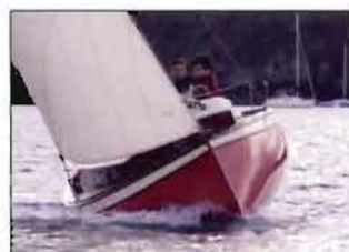
Méaban Petit voilier tout en plaisir