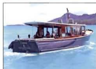
Bora Bora Un taxi pour le paradis