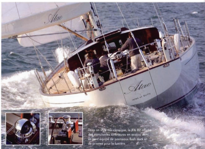
Dans un style très classique, le JFA 82 offre des menuiseries extérieures en acajou verni, un pont équipé de panneaux flush deck et de prismes pour la lumière.

Le chantier JFA de Concarneau développe une lignée de voiliers d'inspiration classique, en y apportant tous les bénéfices d'une conception moderne. Au-delà de l'élégance de sa silhouette, le JFA 82 Classic cache de la haute technologie.