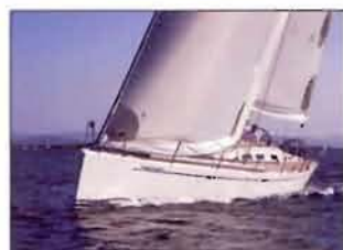
Essai nouveauté X-55, l'art danois